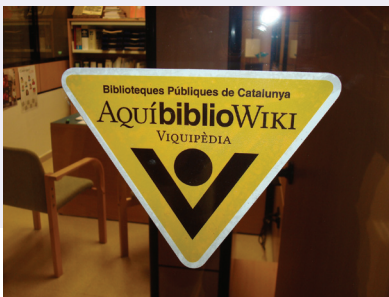
비블리오위키스티커 Bibliowiki Santa Oliva d'Olesa 2.jpg, 사진저작자: Davidpar, 라이선스: CC BY-SA 3.0 ( https://creativecommons.org/licenses/by-sa/3.0 )

또한 사서들은 위키백과 문서의 품질을 향상시키기 위한 글로벌 캠페인의 하나인 1Lib1Ref(한 명의 사서, 하나의 출처라는 의미)에 참여할 수 있다. 위키백과는 백과사전을 지향하는 프로젝트로서 신뢰할 수 있는 출처(reliable sources)에서 확인 가능한 객관적인 지식을 추구한다. 누구나 편집할 수 있는 백과사전이라는 특성으로 인하여 많은 초보자들은 위키백과에 어떤 것이든 작성할 수 있다고 오해하는 경우가 많고, 출처를 제시하는 것에 대하여 익숙하지 않은 경우도 많다. 우리는 출처 인용에 대하여 전문적인 교육을 받은 사서들이 위키백과에 적극적으로 참여함으로써 위키백과에 수록된 정보의 신뢰성을 검증하는 데에 도움을 줄 수 있다고 생각한다.